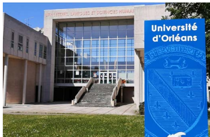
Faculté d'Orléans Château de la Source, 45100 Orléans